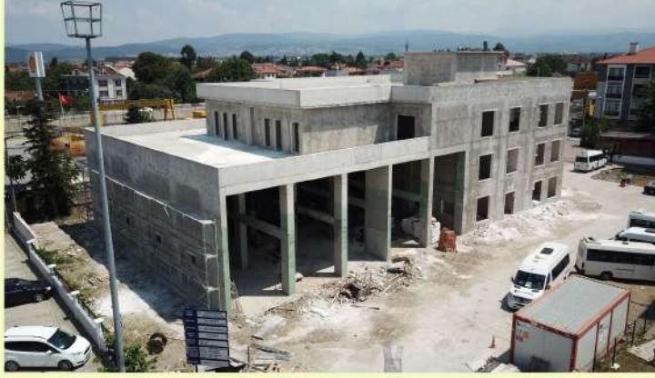
TÜM NOKTALARA 7 DAKİKADA MÜDAHALE

Düzce Belediye Başkanı Dr. Faruk Özlü'nün talimatları doğrultusunda 2020 yılının Aralık ayında ilk kazmanın vurulduğu, Çoban mevkiinde 2 Bin 400 metrekare alan içine inşa edilen yeni İtfaiye hizmet binasının 4 ay içerisinde kaba inşaatının tamamlanmasının ardından ince işçiliğine geçilmiştir.