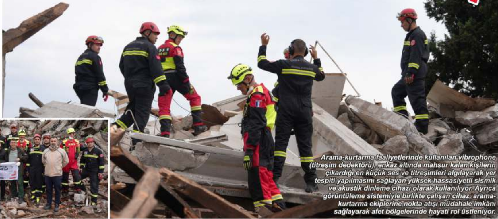
Arama-kurtarma faaliyetlerinde kullanılan vibrophone (titreşim dedektörü), enkaz altında mahsur kalan kişilerin çıkardığı en küçük ses ve titreşimleri algılayarak yer tespiti yapılmasını sağlayan yüksek hassasiyetli sismik ve akustik dinleme cihazı olarak kullanılıyor. Ayrıca görüntüleme sistemiyle birlikte çalışan cihaz, arama-kurtarma ekiplerine nokta atışı müdahale imkanı sağlayarak afet bölgelerinde hayati rol üstleniyor.

Düzce İtfaiyesi, 6 Şubat depremlerinde birlikte görev yaptığı Fransa merkezli GIS-FRANCE ekibini ağırladı. Eğitim ve ortak tatbikat gerçekleştiren Fransız ekip, enkaz altında canlı tespiti sağlayan dinleme ve görüntüleme cihazı "vibrophone"u Düzce İtfaiyesi'ne hediye etti.